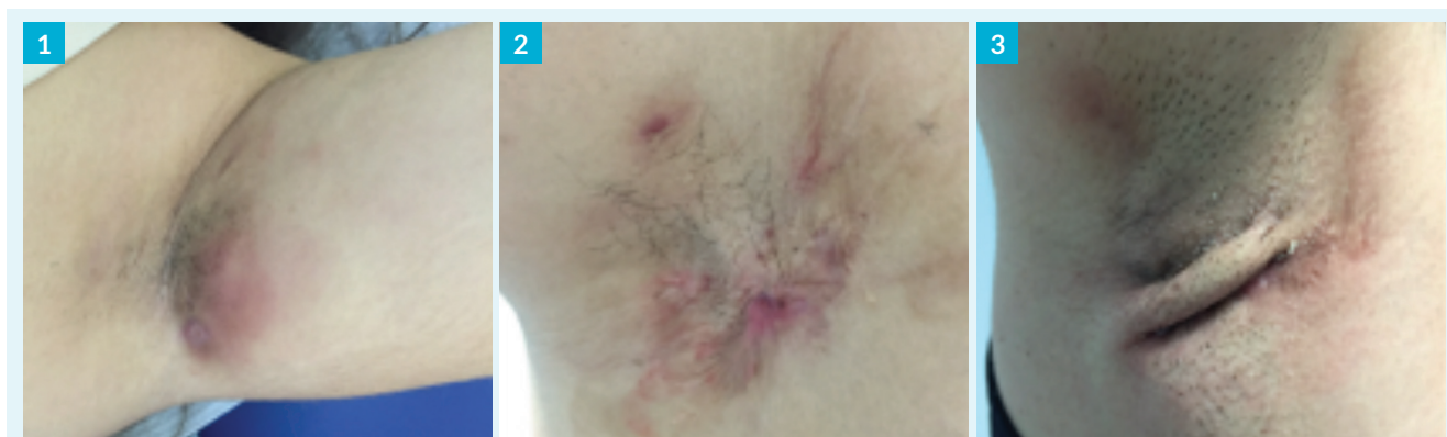
FIGURA 1. (1) Nódulo inflamatório na axila de doente com hidradenite supurativa no estágio de Hurley I; (2) Nódulos inflamatórios associados a fibrose, separados por pele íntegra, na axila de doente com hidradenite supurativa no estágio de Hurley II; (3) Nódulos inflamatórios e abscessos associados a cicatriz, separados por pele íntegra, na axila de doente com hidradenite supurativa no estágio de Hurley II.